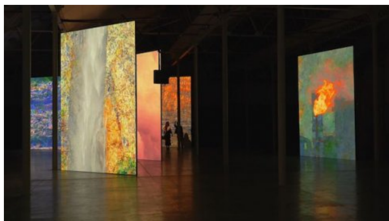
Marée métal - vue d'exposition

Présentation | L'exposition au Lieu unique | Textes de l'exposition