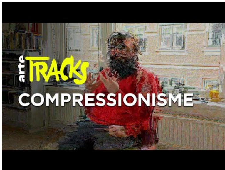
Les peintures numériques de Jacques Perconte | Tracks ARTE (Video Youtube)