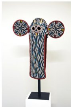
Masque Cagoule "Éléphant", Bamiléké, Cameroun, 1930-1950