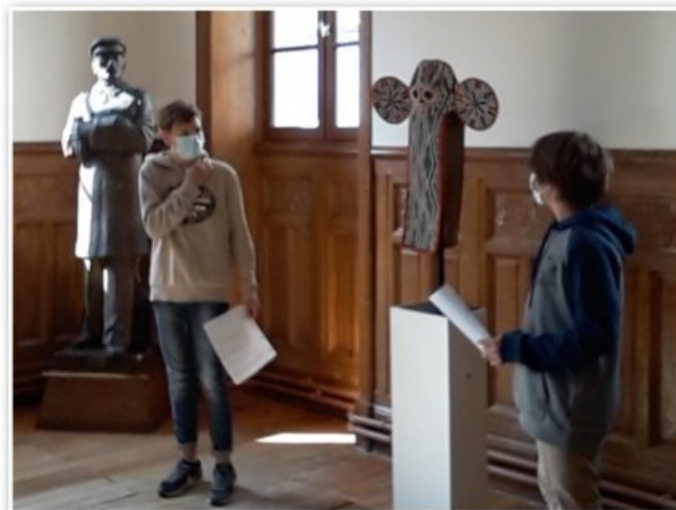
Les élèves de 5 e jouent "Les Colporteurs" pour une autre classe de 5 e : présentation et débat

Donner la parole aux élèves pour questionner notre patrimoine commun, c'est, d'une certaine manière, interroger le regard savant sur les œuvres. Ce savoir, issu d'un partage du sensible, ne peut se créer, que dans une relation d'échange, donc par définition "horizontale", dans laquelle chacun en prenant sa place (artiste, œuvre, regardeur) enrichit les faisceaux de sens et participe à la constitution d'un discours. Ces allers-retours entre le dire, le faire et le voir ne peuvent que consolider notre relation aux œuvres et la communauté des regardeurs.