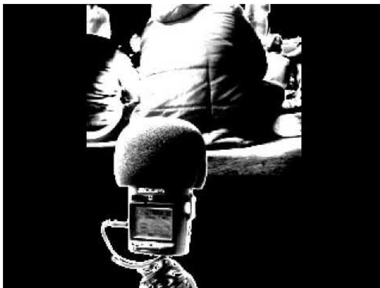
Médiation Serkan et Manissa (Video Youtube)

La vidéo qui suit présente un montage de différents moments d'une de ces médiations. Pour des raisons d'ordre technique, seules les prises de parole des collégiens sont ici utilisées :