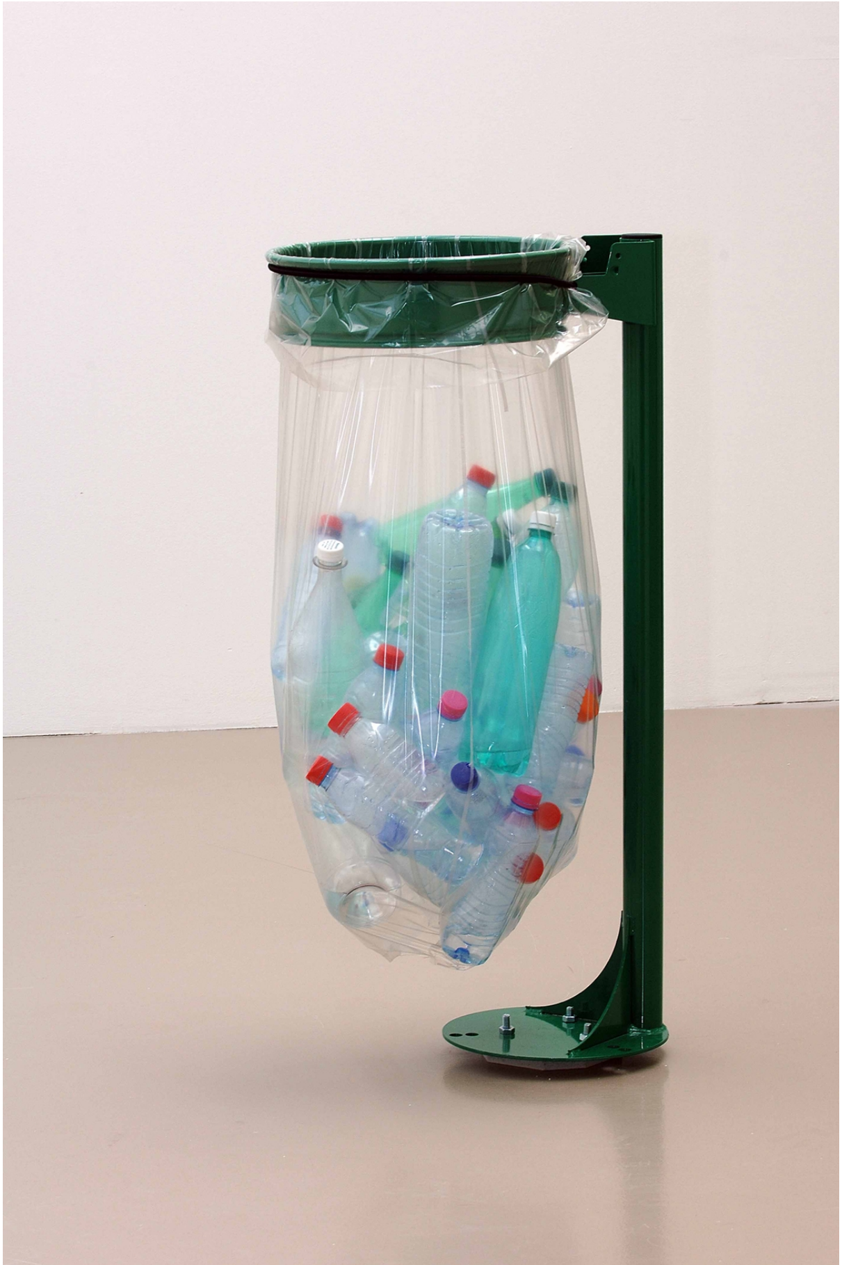
Claire Fontaine, Les refusés , 2007, Deux poubelles Vigipirate, sacs-poubelles, bouteilles en plastique, bouchons, eau, Dimensions variables. Edition de 5