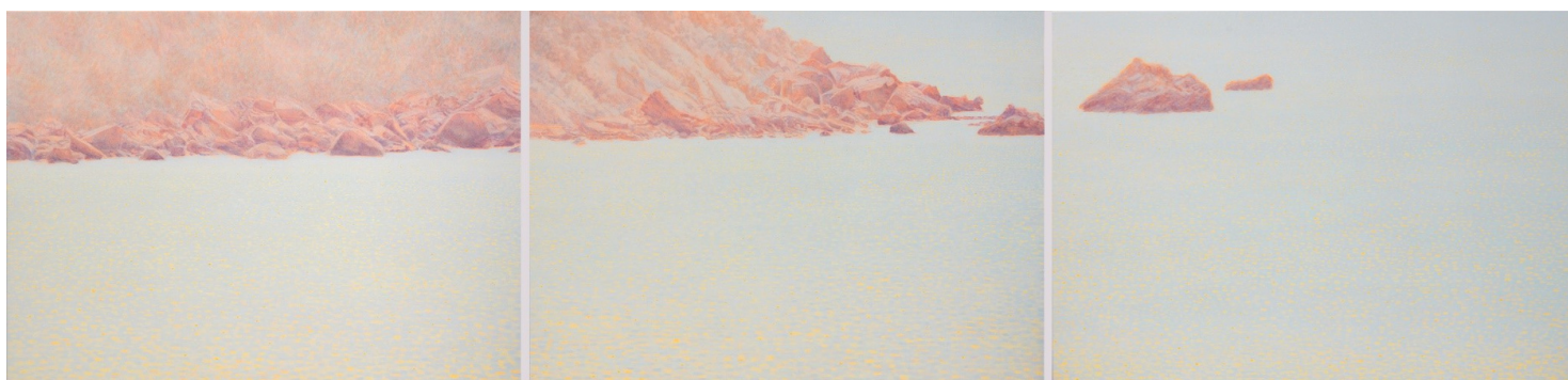
Shimmering, 2022 121 x 510 cm, acrylique et huile sur toile