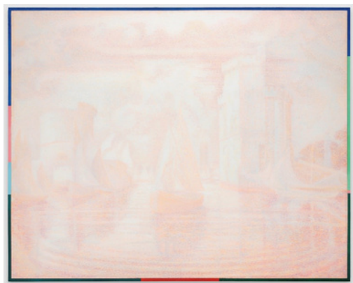
"Still Signac, Signac Still" 2021 130 x 165 cm, acrylique et huile sur toile