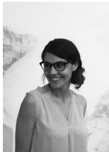
Daniele Genadry - Tous droits réservés

Commissariat d'exposition Fares Chalabi Avec le soutien de l'Ambassade de France au Liban, de l'Institut français au Liban et MediaLAB de La Rochelle Université.