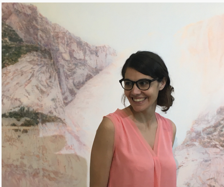
Daniele Genadry - Tous droits réservés