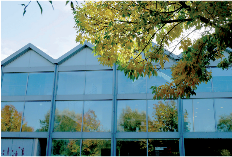
Vue de la Façade du Frac Site d'Angoulême