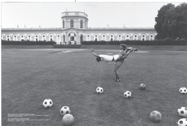
visuel : Alexandre Lenoir Planche extraite du catalogue des sculpteurs, Martin Tupper's showroom

œuvres issues de la collection du Frac Poitou-Charentes