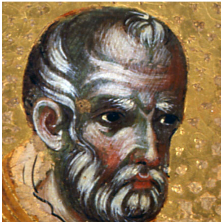
Paolo Veneziano, Saint Nicolas de Bari, détail.

Les figures empruntées des icônes byzantines propres à l'école vénitienne du Trecento, l'œuvre se détache cependant des codes figuratifs (l'icône est écrite) mais aussi ne reste pas figée dans l'iconographie gothique. Le traitement, entre autre, des drapés en témoigne. On peut, ainsi, admirer la modernité, dans le mouvement et la gestuelle donnés aux apôtres, caractéristiques des primitifs italiens, annonçant l'épanouissement de la Renaissance et l'influence incontournable de Giotto.