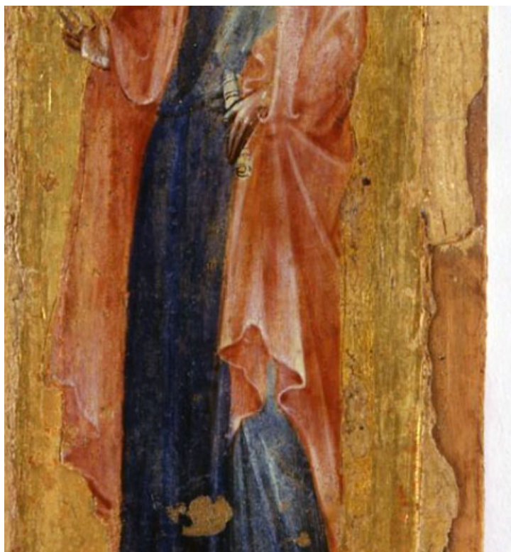
Paolo vénéziano, Saint Philippe, détail du drapé.

Les figures empruntées des icônes byzantines propres à l'école vénitienne du Trecento, l'œuvre se détache cependant des codes figuratifs (l'icône est écrite) mais aussi ne reste pas figée dans l'iconographie gothique. Le traitement, entre autre, des drapés en témoigne. On peut, ainsi, admirer la modernité, dans le mouvement et la gestuelle donnés aux apôtres, caractéristiques des primitifs italiens, annonçant l'épanouissement de la Renaissance et l'influence incontournable de Giotto.