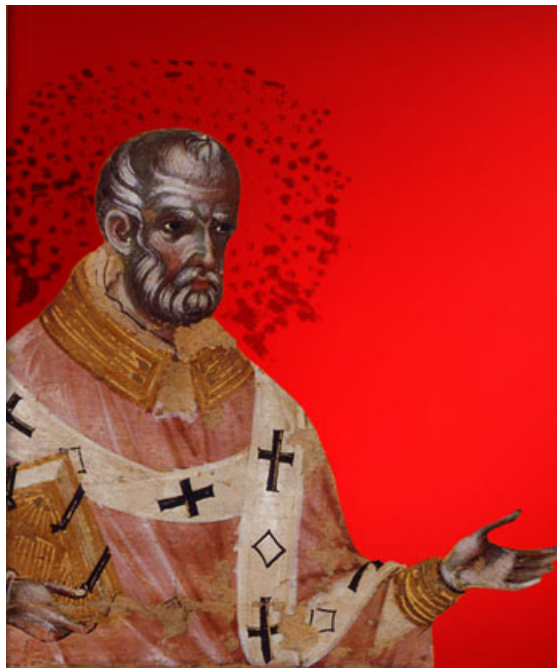
Paolo veneziano, Saint Nicolas de Bari.

Il est resté un bon moment, il ne sait plus, à admirer tous les personnages sur ces petits panneaux de bois peints avec une finesse extrême et une force expressive hors du commun.