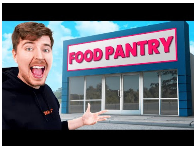
I Opened My Own Charity! (Video Youtube)

Le but de la séance suivante est de confronter une video de M.Beast ( jusqu'à 1.17 ) à la notion de clickbait exposée ci-dessus.