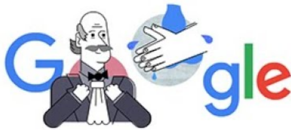
Recognizing Ignaz Semmelweis and Handwashing, support de départ (Video Youtube)