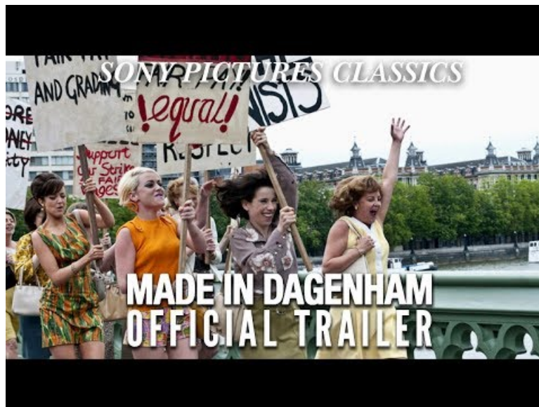
Official trailer de Made in Dagenham (Video Youtube)