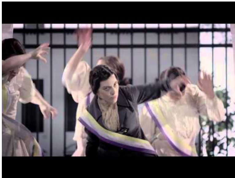
Bad Romance Women's Suffrage (Video Youtube) Video clip