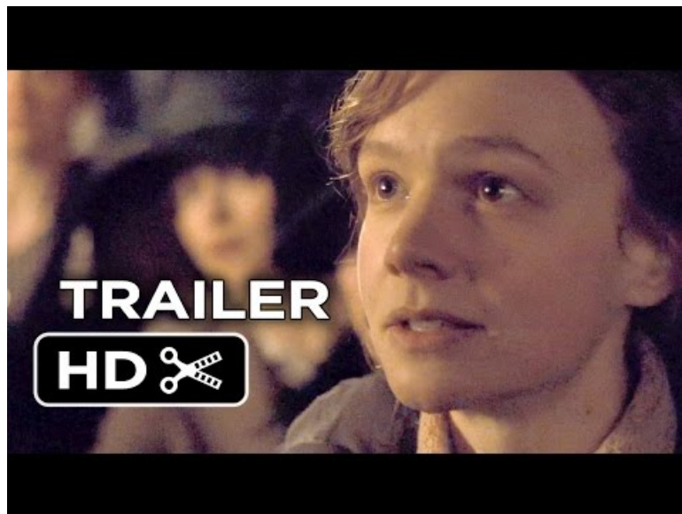
Suffragette Official Trailer #1 (2015) - Carey Mulligan, Meryl Streep Drama HD ( Video Youtube ) Bande annonce du film Suffragette 2015

Les différents documents (tract, affiche, dépliants sur le mouvement des Suffragettes) sont des répliques qui proviennent d'un "replica pack" 🔗 disponible dans les offices de tourisme au Royaume-Uni. Différents thèmes sont abordés comme le Titanic, la Beatlemania, les vacances au bord de la mer, etc. Ces documents peuvent également égayer les murs de vos salles de classe.