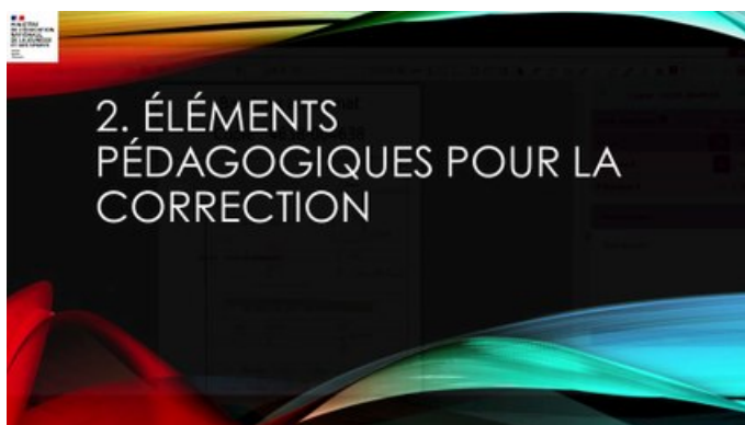
Santorin : système d'aide numérique à la notation et à la correction ( Vidéo Dailymotion )

Présentation de Santorin, système d'aide numérique à la notation et à la correction. Santorin gère la correction dématérialisée d'examens et de concours.