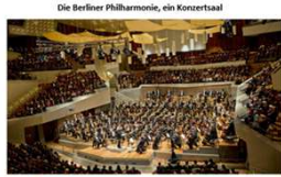
Die Berliner Philharmonie, ein Konzertsaal