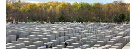
Das Holocaust Memorial