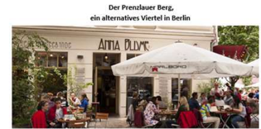
Der Prenzlauer Berg, ein alternatives Viertel in Berlin