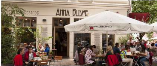
das Café Anna Blume