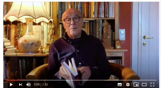
#MyHomeIsMyBurgtheater #17: Michael Heltau

https://www.youtube.com/watch?v=VHY4P1EZUlc