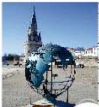
Le monde nous a inspiré en croquant

Un parcours pédestre ainsi qu'un recensement photographique des œuvres parsemées le long de la côte rochelaise permettent aux élèves de découvrir à la fois l'art contemporain mais aussi le patrimoine maritime historique.