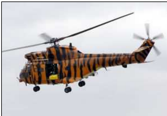
SA 330 Puma hélicoptère militaire de transport moyen franco-britannique biturbine jusqu'à 20 soldats ou 6 brancards (1965)