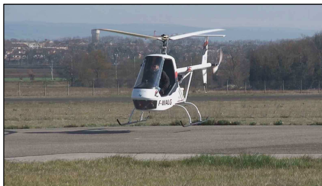
Volta (2016), hélicoptère 100% électrique