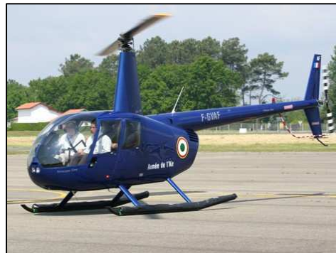
Robinson R44 (1992) hélicoptère civil 4 places moteurs à pistons