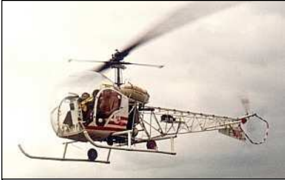
Bell 47 moteur à piston très léger (1945)

SE-3160 Alouette III (1961) performances en altitude et par temps chaud