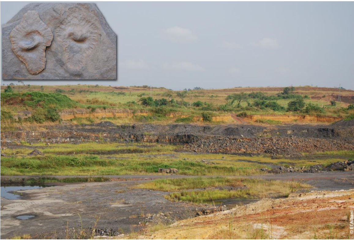
Le site à macro-fossiles de 2,1 Ga affleurant près de la ville de Franceville, au Gabon