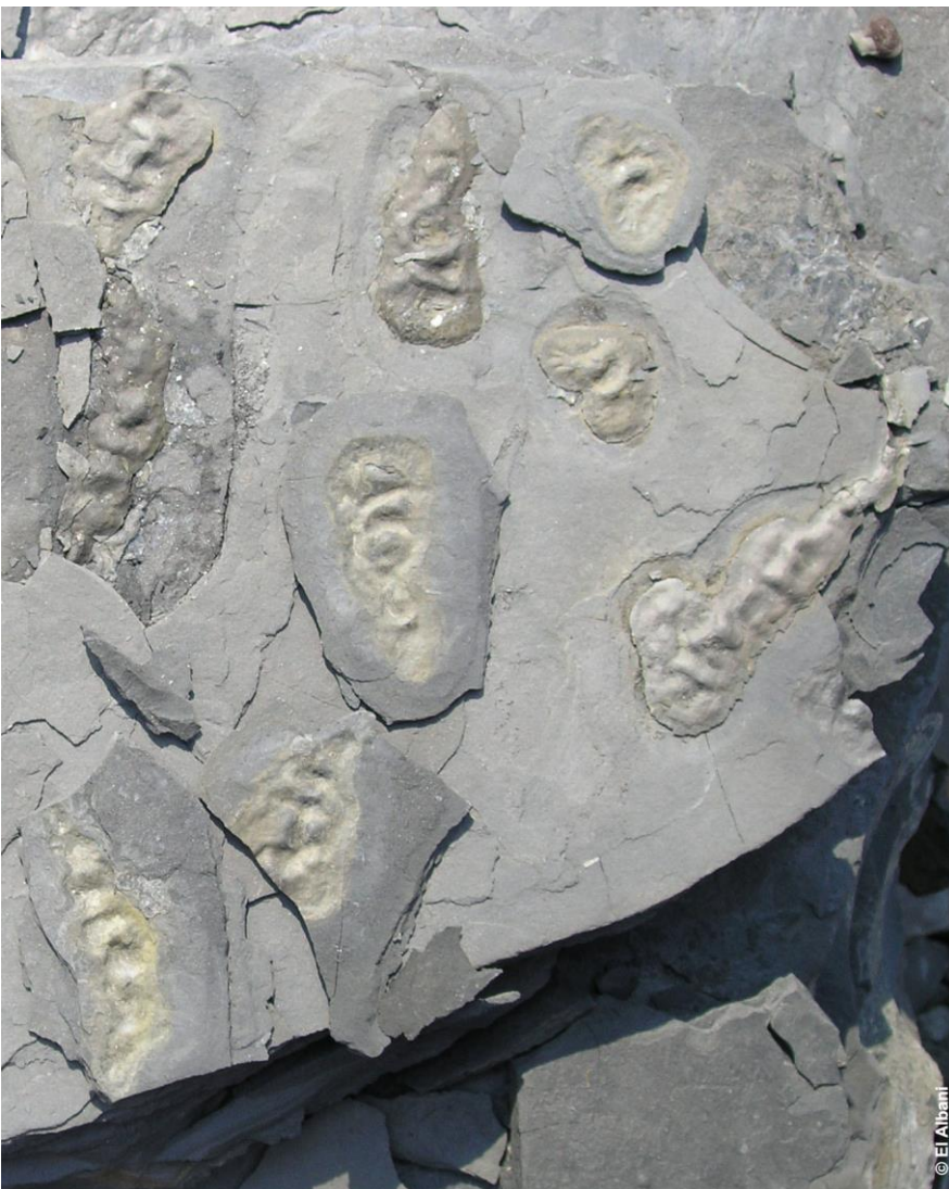
Les restes fossilisés des macro-organismes coloniaux du Gabon (© El Albani )