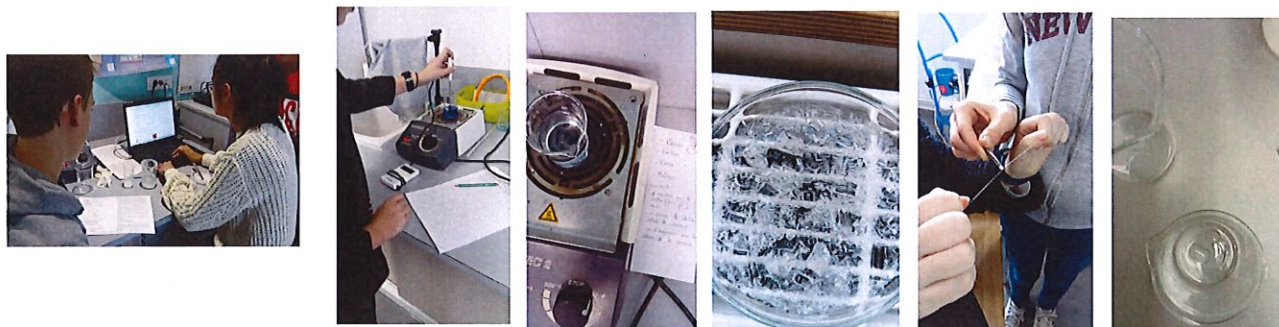
Photos prises pendant les essais du mois de décembre 2019 des différents groupes.

Après cette manipulation, nous attendons plusieurs jours et revenons tous les jours pour vérifier que de beaux petits cristaux se forment (le plus réguliers possibles).