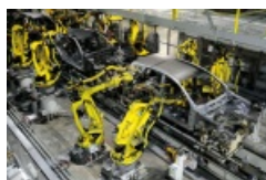
La productivité (Learning Apps)

Si seule l'activité 1 est réalisée à la maison, il faut ajouter trente minutes à la séance.