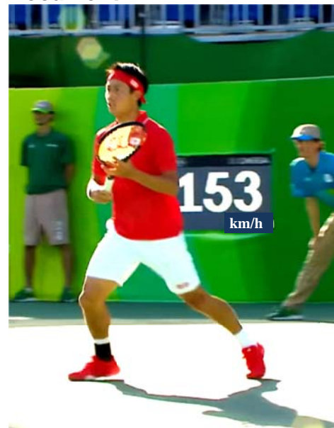
Document 1 :