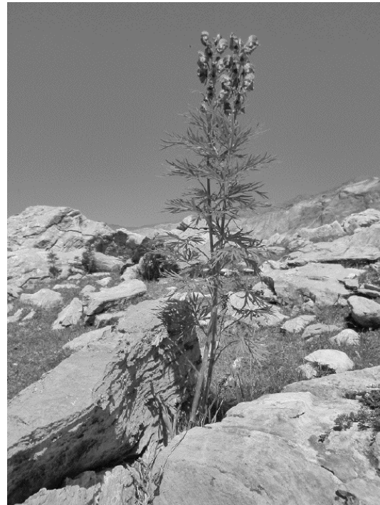
Figure 5 Image 'fleur' 16 niveaux de gris (taille : 170 ko)

De plus pour l'image codée sur 256 niveaux de gris, la valeur du pixel de coordonnées (54,51) (situé en haut à gauche « dans le ciel ») est de 120.