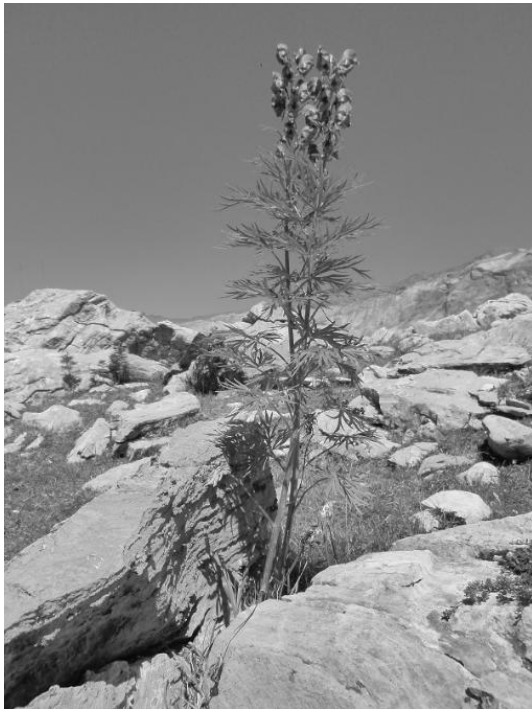
Figure 4 Image 'fleur' 256 niveaux de gris (taille : 336 ko)