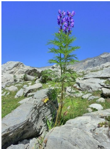
Figure 7 Valeurs RGB d'un pixel

On dit que les images obtenues sont en couleurs « vraies ». La qualité colorimétrique obtenue est celle d'une photographie argentique couleur.