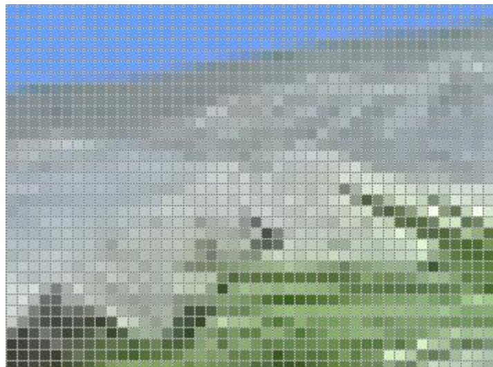
Figure 2 Zoom de l'image 'fleur'

La pixellisation d'une image, appelée aussi définition, est le nombre de points la composant. Ainsi, toute image est constituée de la juxtaposition de points. Sur notre image 'fleur', nous avons 800 lignes comportant chacune 600 points soit un total de 480 000 points ayant chacun une couleur pour la représenter.