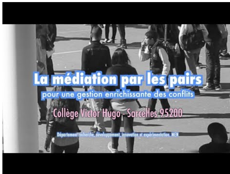
La médiation par les pairs au collège Victor Hugo de Sarcelles 95200 (Video Youtube)