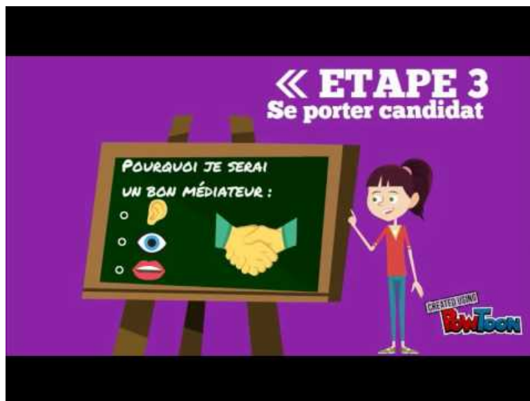
Médiation par les pairs (Video Youtube)