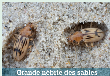
Grande nébrie des sables