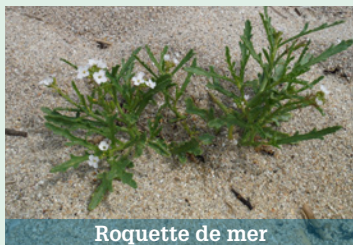
Roquette de mer