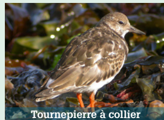
Tournepierre à collier