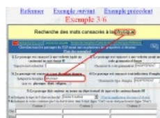
Extrait de l'aide dans le TLFi (cliquer pour agrandir)

Ils améliorent également leur capacité à exploiter un document numérique , et peuvent ensuite faire attester cette capacité dans le cadre du B2I collègue .