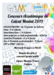
Affiche du concours académique de calcul mental 2019

Cet article décrit le calendrier et les modalités d'inscription du concours académique de calcul mental en ligne, édition 2019, organisé depuis 6 ans dans l'académie.