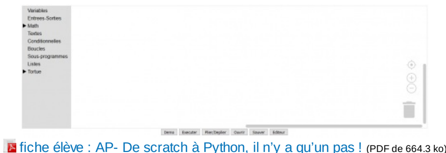
fiche élève : AP- De scratch à Python, il n'y a qu'un pas ! (PDF de 664.3 ko) fiche élève : AP- De scratch à Python, il n'y a qu'un pas !

De plus, j'ai choisi d'utiliser l'interface Sofuspy développée par l'IREM de la Réunion pour pouvoir passer d'un langage par blocs, Blockly (proche de Scratch) à celui de Python.