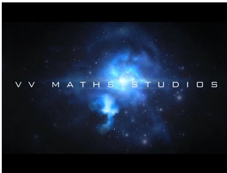
Teaser de la semaine des mathématiques 2021 ( Video Youtube ) Bande-annonce du concours d'énigmes de la semaine des maths