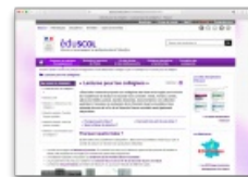
Extrait de la page « Lectures pour les collégiens » - Éduscol.fr