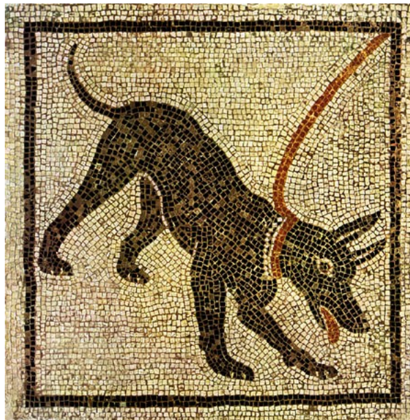
mosaïque trouvée à Pompéi / © Bidgeman-Lauros-Girodon.

PLINE l'Ancien, Histoire naturelle , VIII, 61 (traduction Rallye-Latin)