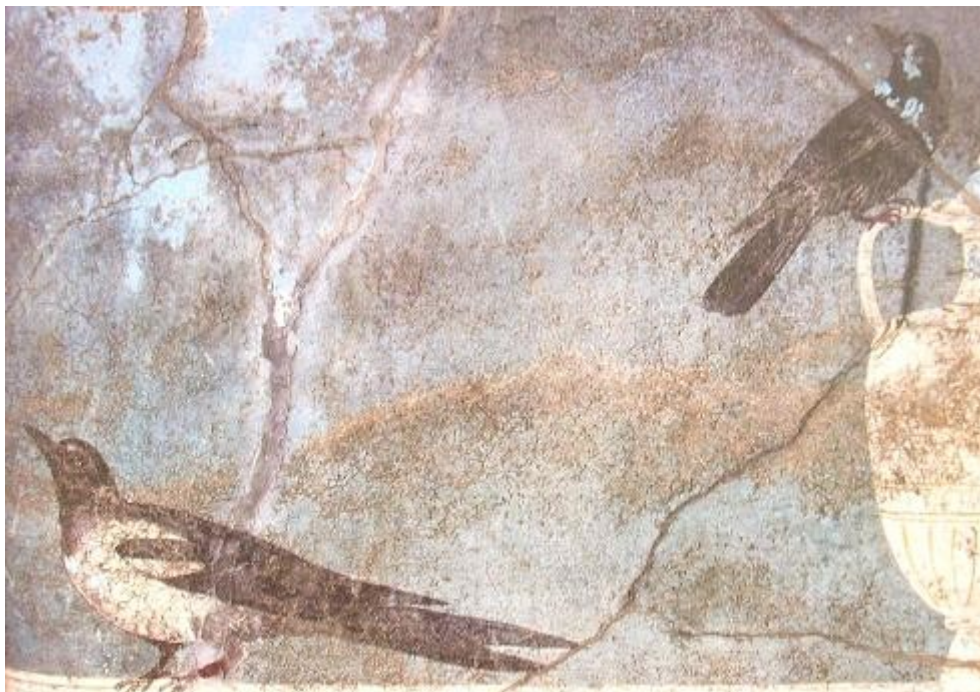
oiseaux (détail d'une fresque de la Villa des vergers à Pompéi)

MACROBE, Saturnalia , II, 4 (traduction Rallye-Latin)