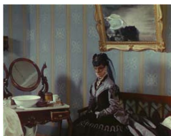
Morte a Venezia , 1971