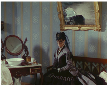
Morte a Venezia , 1971