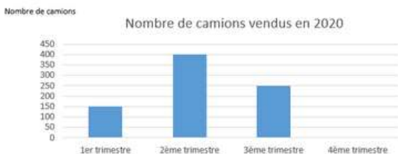
Ventes du 4ème trimestre

3. Le vendeur de camions. A Delhi, le vendeur de camions fait les comptes de ses ventes pour l'année 2020. Combien de camions ont été vendus en 2020 ?