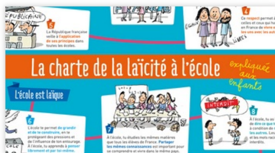
Image de la Charte de la laïcité à l'école expliquée aux enfants