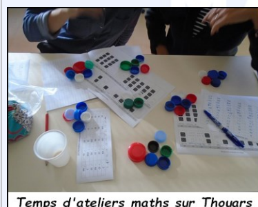
Temps d'ateliers maths sur Thouars

Voici quelques traces de leur vécu de ces journées ( plus de photos et témoignages sur la version en ligne ) :