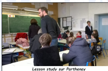
Lesson study sur Parthenay

Un grand merci aux enseignants et aux formateurs pour cette mutualisation !