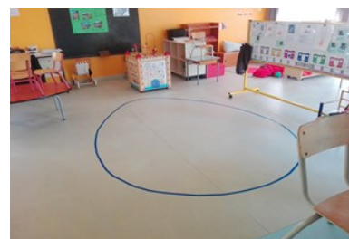
Exemples de regroupement