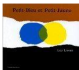
Petit-Bleu Et Petit-Jaune, Leo Lionni, Ecole des Loisirs Cycle 1