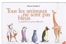
Tous les animaux ne sont pas bleus : le grand livre des petites différences, Béatrice Boutignon. Le baron perché, 2010 Cycle 1