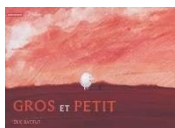
Gros et Petit, Eric Battut, Autrement jeunesse Cycle 1