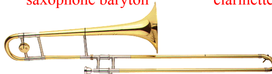
trombone à coulisse