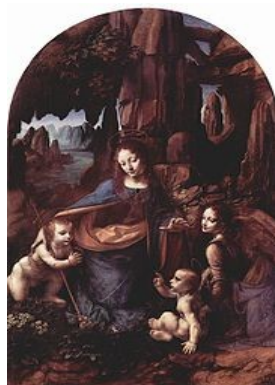
La vierge aux rochers, v.1508