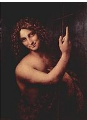
St-Jean Baptiste v. 1514