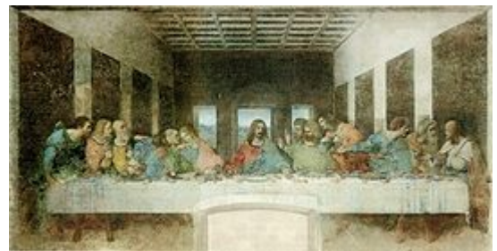
La cène 1495-1497