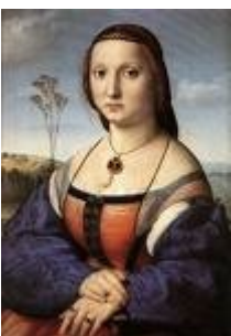
Maddalena Doni 1505-1506 Raphaël (1483-1520)