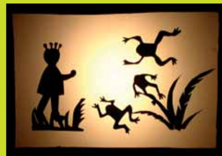
▲ INDUCTEUR VISUEL

Amener les élèves à développer des compétences à la fois en arts visuels, en maîtrise de la langue et dans le domaine technologique.