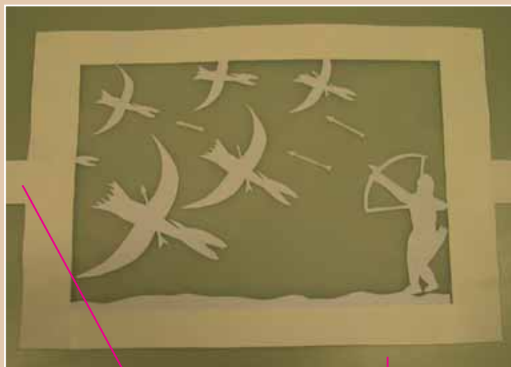
Languettes de manipulation

Les éléments composant la scène sont reproduits sur du papier légèrement cartonné, puis collés sur le papier calque.