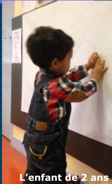
L'enfant de 2 ans