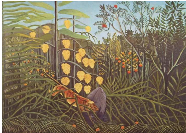
Combat du tigre et du buffle, 1908 Huile sur toile, 172 x 191,5 cm Cleveland, The Cleveland Museum of Art Donation Hanna Fund

Les jungles sont l'une des thématiques les plus fécondes du peintre qu'il poursuit jusqu'à sa mort.