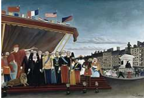
Les représentants des puissances étrangères venant saluer la République en signe de paix, 1907 Huile sur toile, 130 x 161 cm Paris, Musée du Louvre, donation Picasso

Henri Rousseau est considéré comme un précurseur de Pop Art: il utilise le noir proscrit par les impressionnistes, il peint des surfaces pures, il place l'objet connu dans ses tableaux.