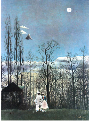
Un soir de carnaval, 1886 Huile sur toile, 106,9 x 89,3 cm Philadelphia Museum of Art, collection Louis E. Stern

Il rentre dans la scène artistique en 1885.( Salon des Refusés). Il participe à l'exposition spectaculaire de la « Société des Indépendants » du 18 août 1886.