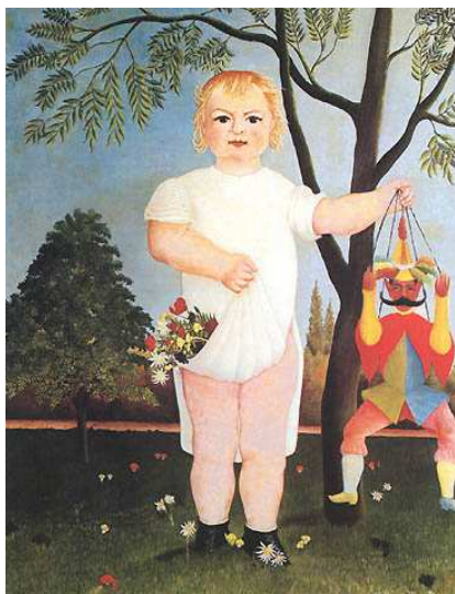
L'enfant au polichinelle, 1903 Huile sur toile, 100 x81 cm Winterthur, Kunstmuseum

Il se marie en 1869 et aura un fils et trois filles. Sa première femme meurt et il se marie une deuxième fois, mais sa seconde épouse meurt également. Rousseau, dont quatre enfants sont morts de tuberculose, peint « L'enfant au polichinelle »