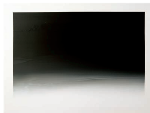
Rémy Hysbergue Étendues II (E 0308) , 2008 acrylique sur toile tendue sur bois 118 x 90 x 2 cm Collection FRAC Poitou-Charentes

Artothèque du Limousin Musée des Beaux-Arts d'Angers Musée Oohara, Japon F.N.A.C. Paris FRAC Auvergne FRAC Poitou-Charentes F.M.A.C. Paris