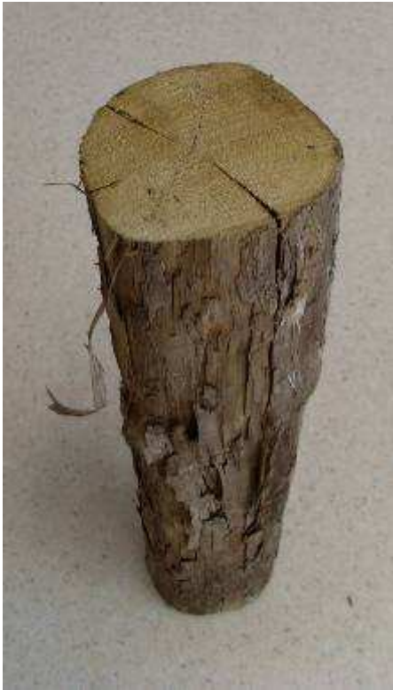
Nous avons observé un morceau de tronc.