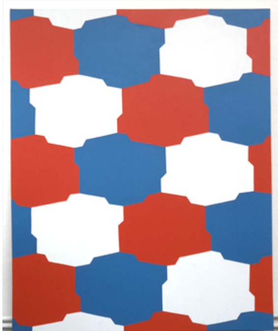
TRACES-FORMES Hexagonales s'engendrant les unes les autres, alternativement, en bleu, en rouge, en blanc, 1974-75 peinture acrylique sur toile 181,5 x 146 cm

Issue d'une méthode volontairement simple et répétitive, la peinture de Ristori n'offre pas de prise à une conception émotionnelle de l'art. La surface peinte n'a d'autre signification que son existence, et son processus de construction n'a de justification qu'en fonction des développements qu'il permet. Les couleurs sont utilisées pour leur capacité visuelle immédiate, et toujours répétées pour éviter toute lecture préférentielle. Ce système de construction de la peinture permet à l'artiste d'observer un total détachement. Annulant tout affect, il se libère des interprétations équivoques. Et pourtant la particularité de ce travail est de conserver une dimension sensible qui oblige au regard. La trace-forme est devenue le signe de Ristori, lui permettant d'engendrer de nouvelles situations visuelles en peinture.