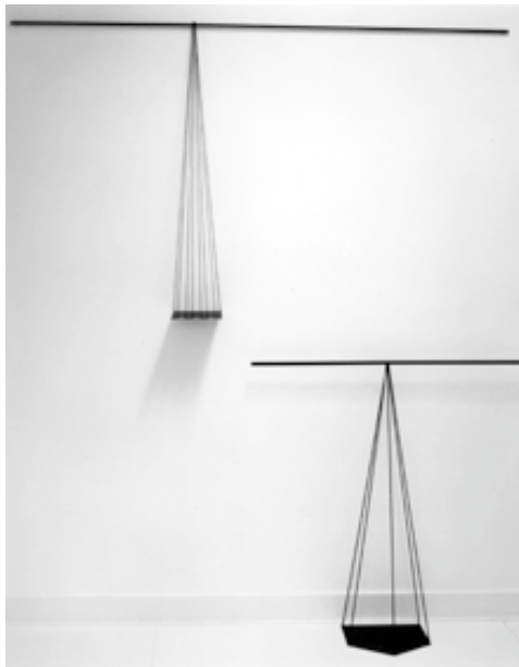
Point de vue , 1983/84

fer et cordelette 100 x 99 x 30 cm et 177 x 100 x 15 cm