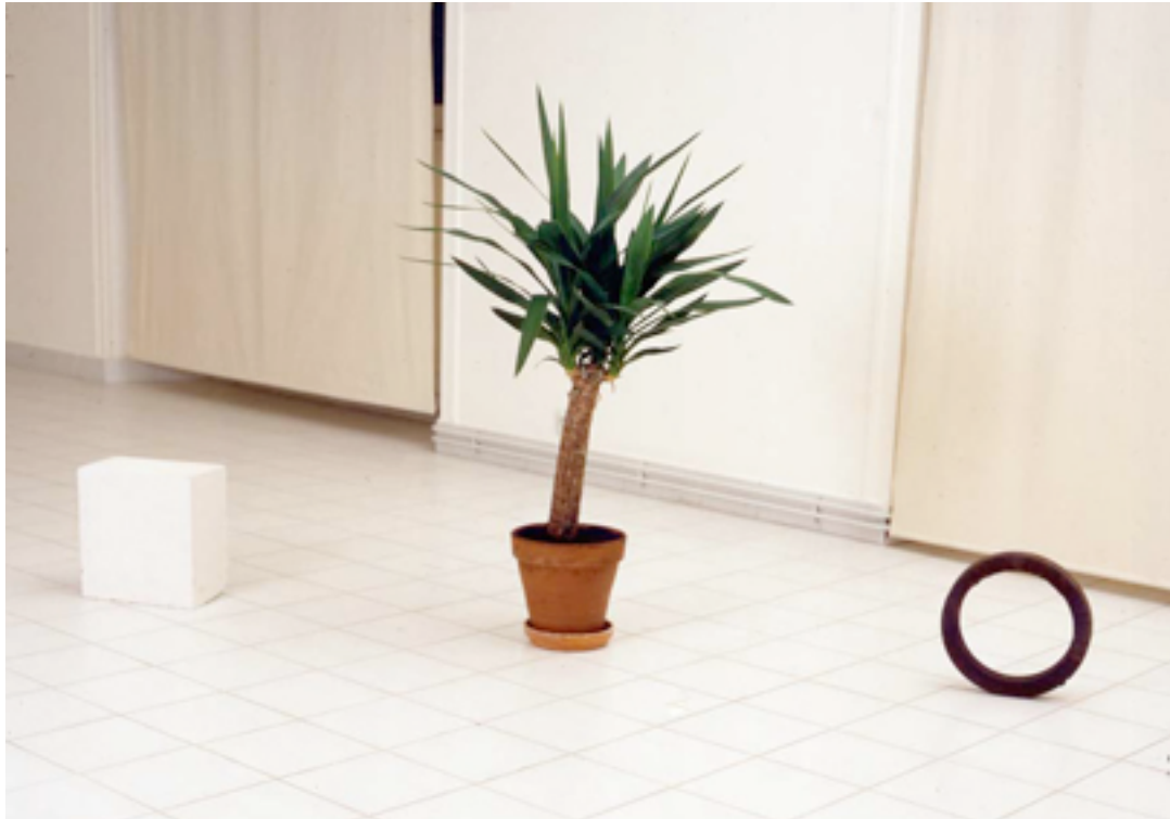
Trois objets d'un poids absolument identique , 1977 fonte, plante, béton cellulaire

Né en 1952 à Creutzwald. Vit et travaille à Paris.