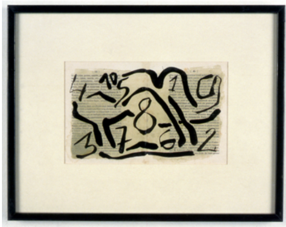
Sans titre , 1982

4 peintures sur papier, 14,5 x 24 cm - 13,5 x 21,5 cm - 14 x 22 cm - 13,5 x 21,5 cm