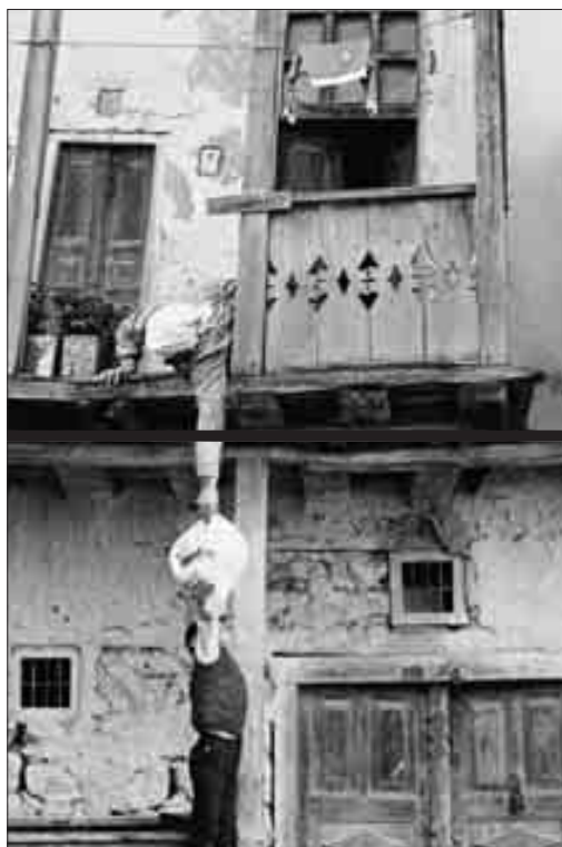
Collage des photos 7 et 8 (ici légèrement recadrées) avec la marque de l'interimage.