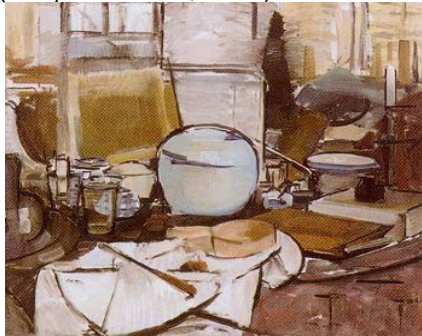
Nature morte au pot de gingembre 1911

(1912). De même les bateaux d'un paysage marin se réduisent à une juxtaposition de croix noires ( Composition n10 , 1915).