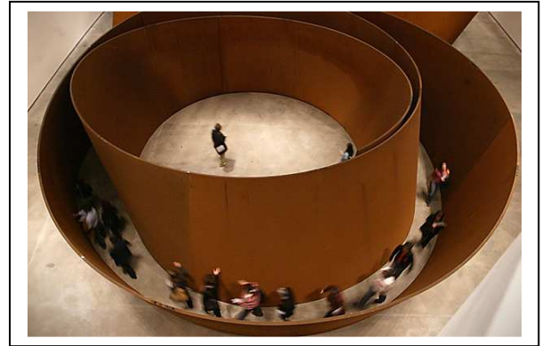
Richard Serra, Guggenheim Bilbao