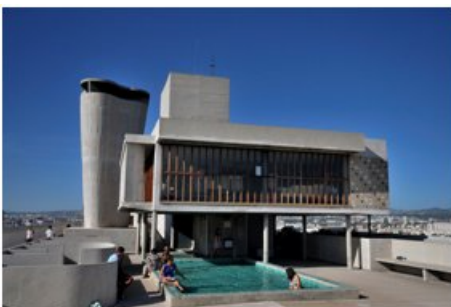
La piscine pour enfants, sur le toit, dans la zone été

L'innovation que représentait cette construction lui a valu le surnom péjoratif de maison du fada. Aujourd'hui classée monument historique par arrêté du 12 octobre 1995, la Cité Radieuse, immeuble expérimental dès son origine, est de plus en plus visitée par des touristes et ses logements exercent un nouvel attrait auprès d'une population de cadres et de professions intellectuelles.