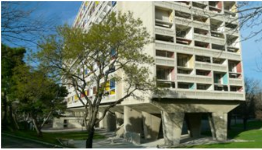
Vue extérieure de la cité Radieuse : pilotis « brutalistes », loggias, pare-soleil.

De 1945 à 1952, Le Corbusier construit la Cité radieuse de Marseille. Il s'agit de sa première unité d'habitation.