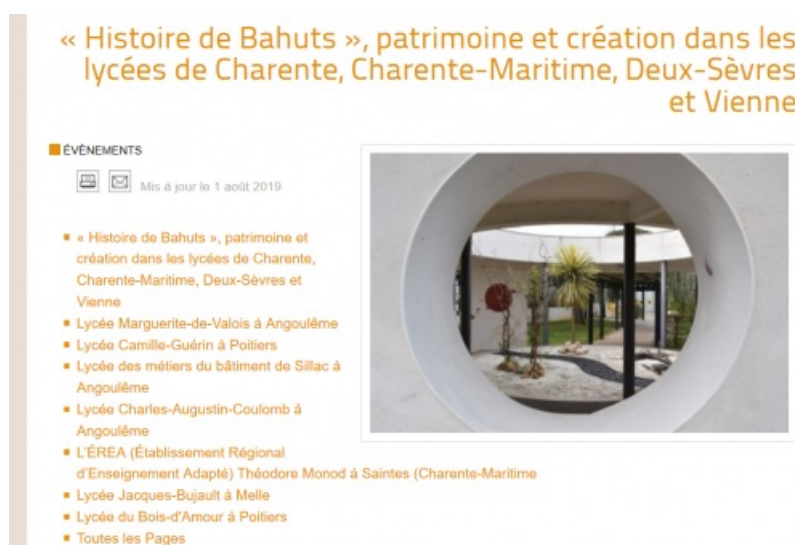
Capture d'écran du site Inventaire Poitou-Charentes.fr

Le site Inventaire Poitou-Charentes.fr a recensé les différents actions des lycées.