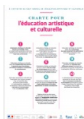
La Charte pour l'éducation artistique et culturelle (PDF de 780.8 ko)